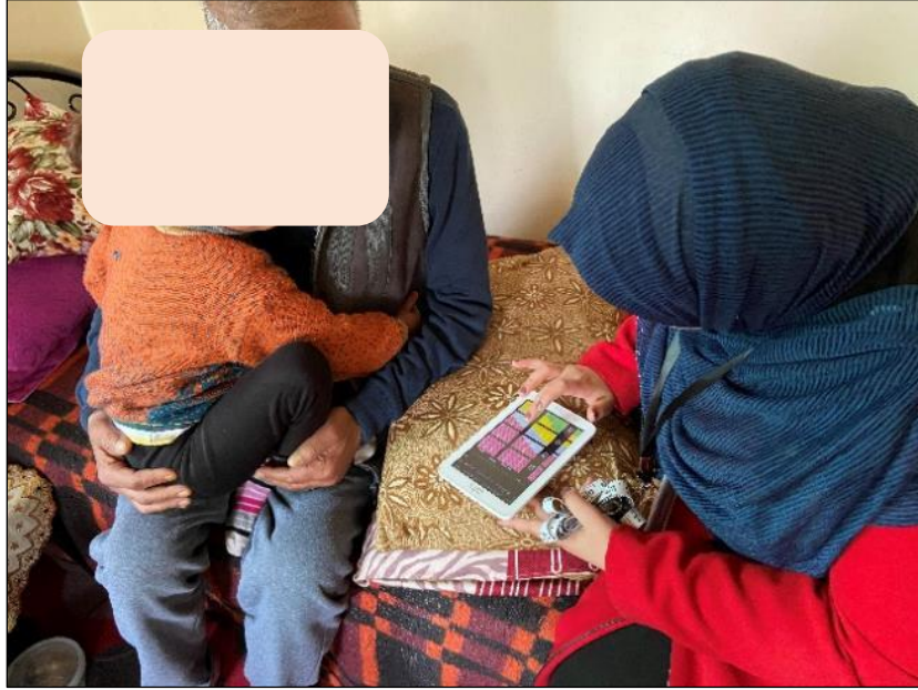
الصورة: متطوع صحة المجتمع يقوم بزيارة منزلية شخصية في بداية الدراسة في فبراير 2020 ، (قبل جائحة كورونا)

✓ لأولئك الذين تم تشخيصهم في بلد مضيف بعد النزوح. 6 بالنسبة للمرضى الأكثر استقرارًا ، يمكن للمتطوعين الصحيين تقديم التثقيف الصحي التأسيسي بتكرار أقل. (على سبيل المثال 3 زيارات في السنة للتأكيد على بروتوكولات الإدارة الذاتية للمرض ؛ والتعرف على علامات الخطر والمضاعفات؛ تعزيز النشاط البدني ؛ تقديم المشورة بشأن النظام الغذائي ؛ الرعاية النفسية والاجتماعية).